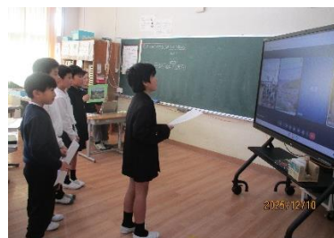
↑ 電子黒板の向こうで西鶴山小学校の児童たちが真剣に聞いてくれています。

名前も似ていて同じくらいの規模の二つの学校。交流を通して、それぞれの地区の特徴に関心をもつと同時に、親近感がわいたようです。