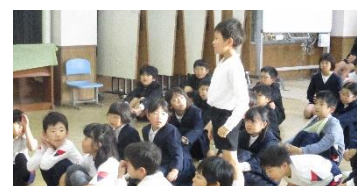
↑ 人権朝会 「人権とは？」について考えて発表