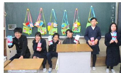
↑プレゼントをもらいました

最後に、1～5年生が花のアーチをつくり、6年生を送りました。1年間、最高学年としていろいろな行事や活動でがんばった6年生。1年間を振り返り、がんばった自分をしっかりほめてほしいと思います。