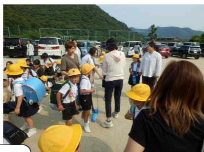
授業参観・救急法講習会・引き渡し訓練