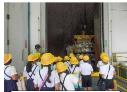
4年 クリーンセンター見学