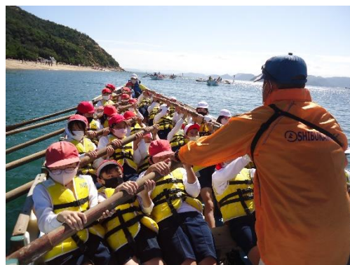
【カッター研修の様子】