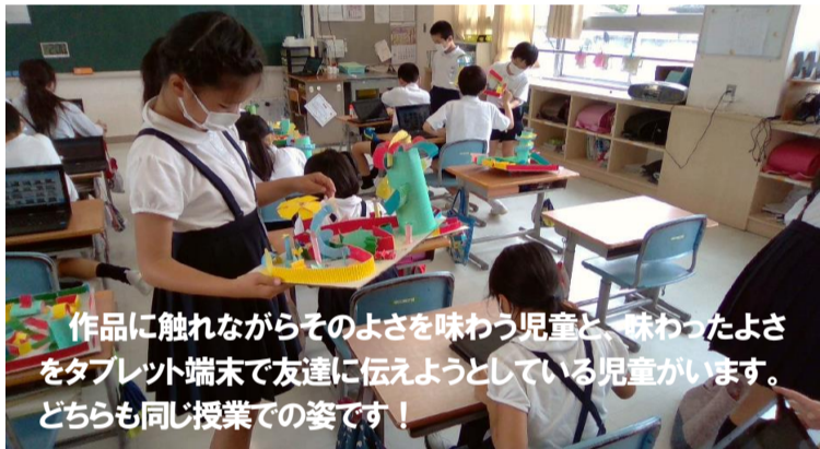
作品に触れながらそのよさを味わう児童と、味わったよさをタブレット端末で友達に伝えようとしている児童がいます。どちらも同じ授業での姿です！

GIGAスクール構想（GIGA：Global and Innovation Gateway for All）とは、「児童生徒向けの1人1台端末と、高速大容量通信ネットワークを一体的に整備し、多様な子どもたちを誰一人取り残すことなく、公正に個別最適化された、創造性を育む教育を、全国の学校現場で持続的に実現させる構想」です。その中で「目指すべき次世代の学校・教育現場」として次のような視点が示されています。（一部抜粋）