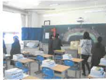
教室の飾り付けもバッチリ。