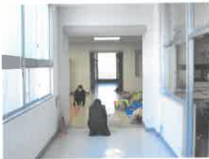
廊下だってぞうきん掛けだい！