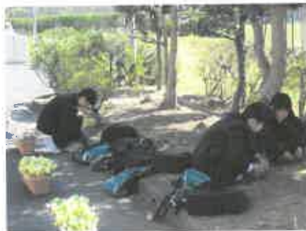
プランターを並べ草をむしり・・・