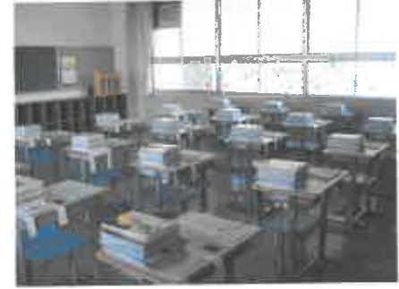
後は座る人を待つのみ。