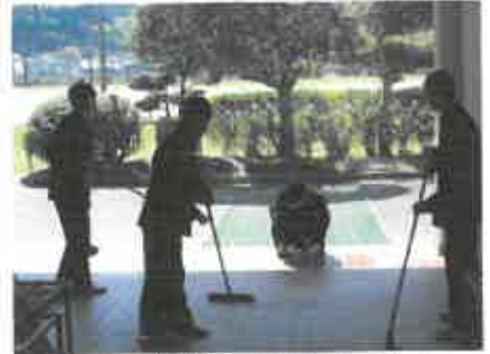
もちろん昇降口もぬかりなし！