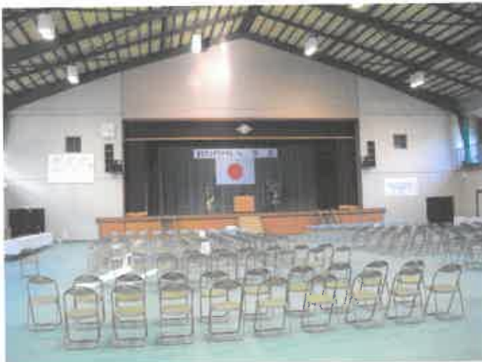
そして出来上がった会場。ここで入学式が。

1年生のみなさん、こういう風に全校生徒、教員が総力を上げ、みなさんを迎える準備をしました。教室も、教科書運び込み、飾り付けもしました。