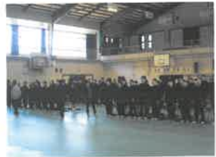
迎えるために校歌を練習。