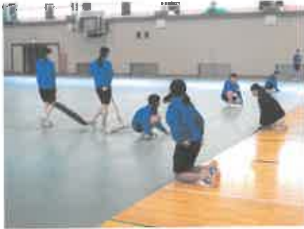
シートを美しくピン！と張ります。

新入生のみなさんに向けて、全校を挙げて準備をしています。 今回は、2年生、3年生たちを中心に準備の様子を紹介します。