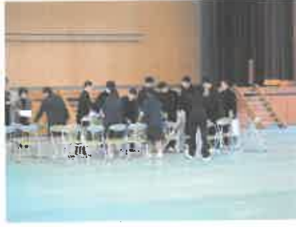
そして椅子を次々と・・・