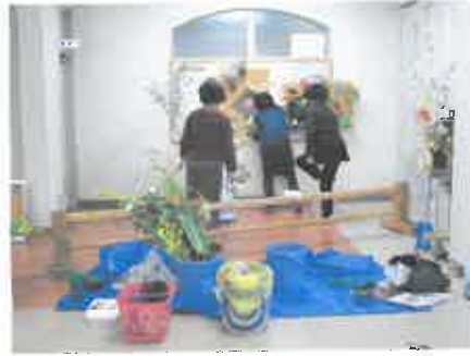
お花の先生も張り切ってます！