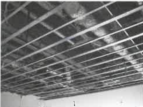
工事中のトイレの天井

それは23日(金)の給食準備中のことでした。全てはその一言から始まったのでした…。