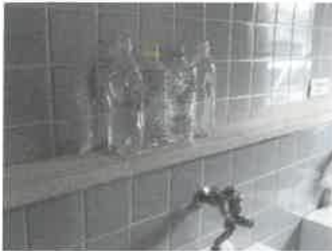
用意されたペットボトル