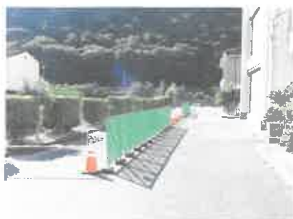
南棟・緑陽会館前

合唱コンクール前は混雑が予想されますので、可能な限り乗り合わせ、徒歩、自転車等でお越しいただけるとありがたいです。