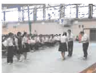
表彰です。おめでとう。