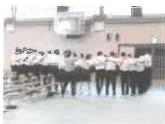
全員で輪になって気合いを入れて、3年学年合唱だ！