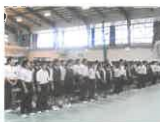
最後の校歌も声高らかに。