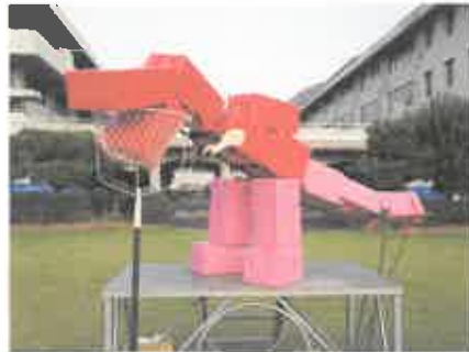
こ、これは何でしょう？実行委員が頑張った景品の恐竜です。