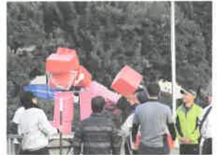
景品を受け取る？崩す？名付けて「チームビリビリ (備里備里)」