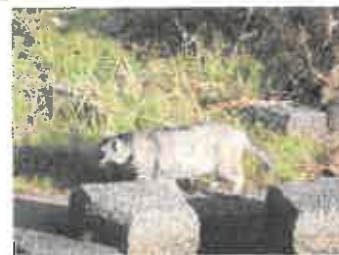
こんなネコでした♡

これは一大事と、駆けつけました私。しばし川面を睨んでいましたが、そのうち去って行きました。当のカモちゃんたちは、全然危機感もなく、悠々と泳いでいます。むしろ近づいてるじゃん！ハラハラドキドキです。