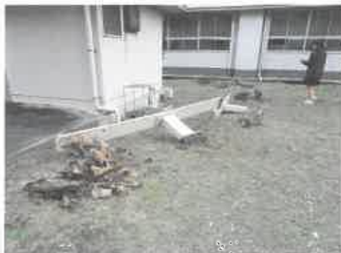
崩れゆくロマンチックベンチ

するとホラ、あなたの目に先には輝く「クリスマス」が、「お正月」が…来るといいね（願）。