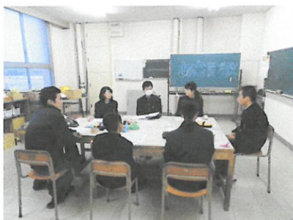
生徒会本部の円卓会議（笑）。