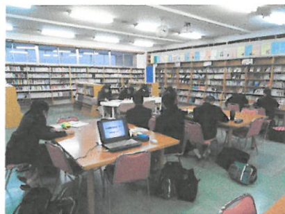
図書室では図書委員会。