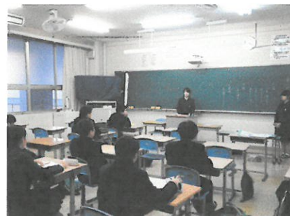
文化委員会の話し合い。