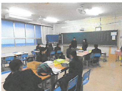
環境委員会の話し合い。