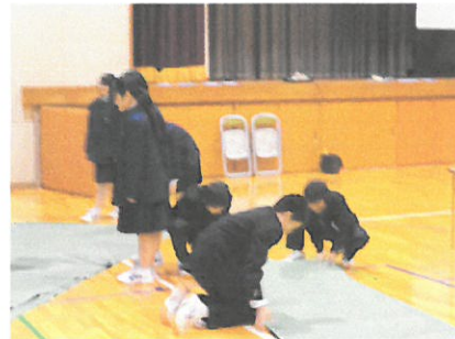
学級委員は、人権集会のリハーサルの準備中でした。