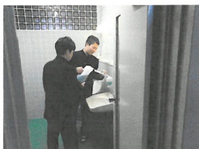
保健委員会はアルボースの補充を。