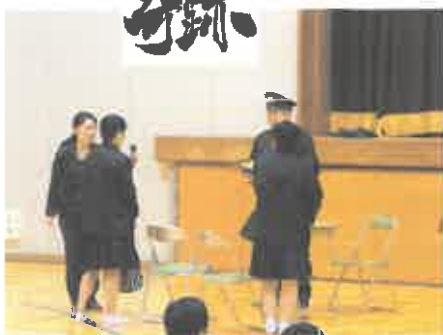
交番に駆け込んで…