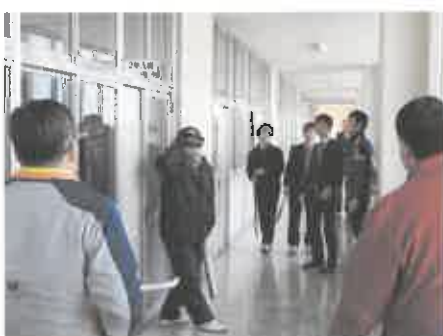
体を張る 走のために！