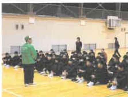
スクールサポーターのお話