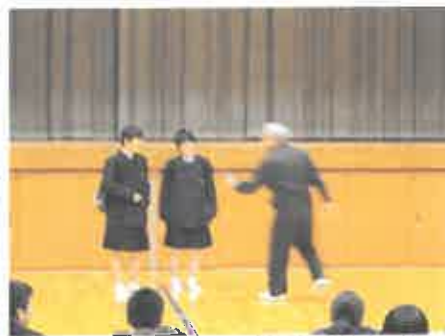
ねえねえアイドルにならない？