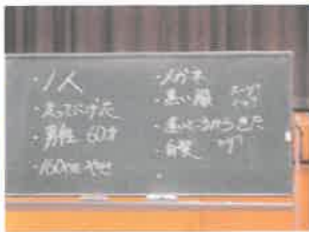
これだけのことを覚えてました