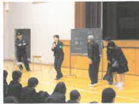
いろんなアドバイスを受けます