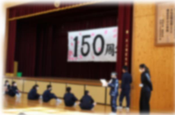
2部も6年生の司会で進みました。