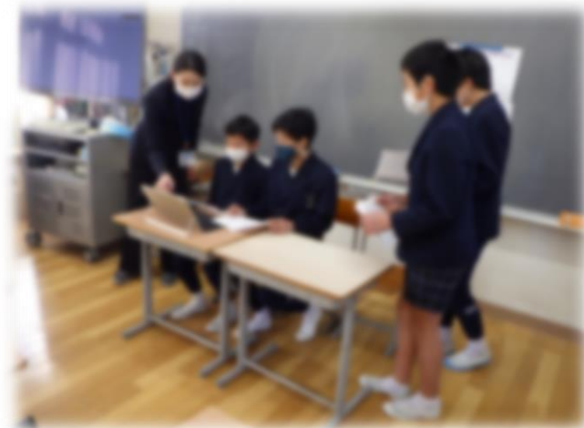
6年生が6年教室から配信して司会進行