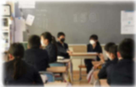
5年生が5年教室から配信してクイズ出題

Q.今までで、一番多い児童数は何人でしょうか? A 1010人 B 1200人 C 1055人